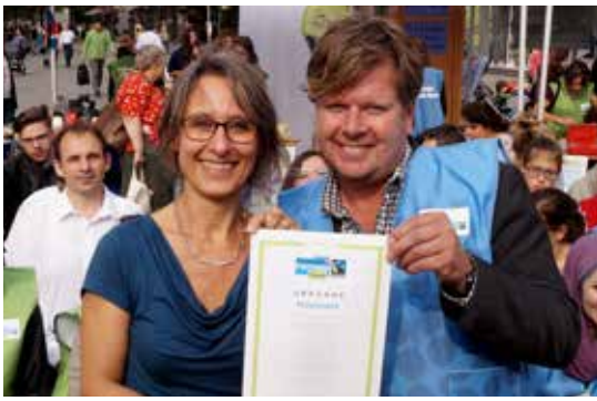
Wiederauszeichnung als Fairtradetown im Rahmen der Fairen Woche 2016