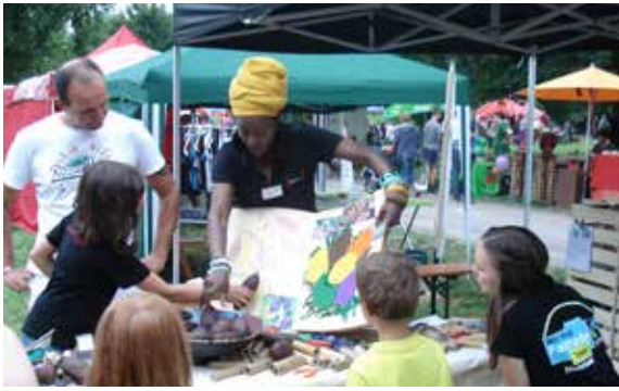
Bildungsarbeit am Beispiel Kakao