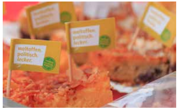
Selbstgemachte Kuchen aus fairen Zutaten von Fairtrade Schools