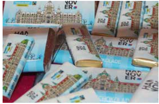
Faire Bio-Schokolade als Botschafter des Fairen Handels.