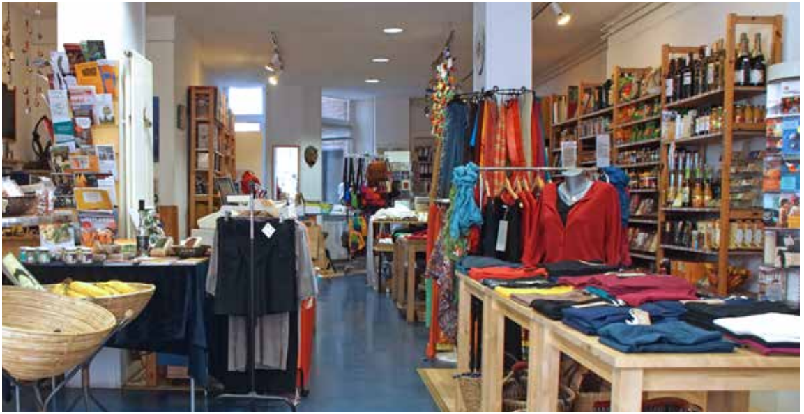
Der Allerweltsladen: faire Produkte, Bücherei, Veranstaltungen und mehr ...